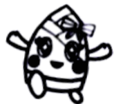
寄宿舎マスコット